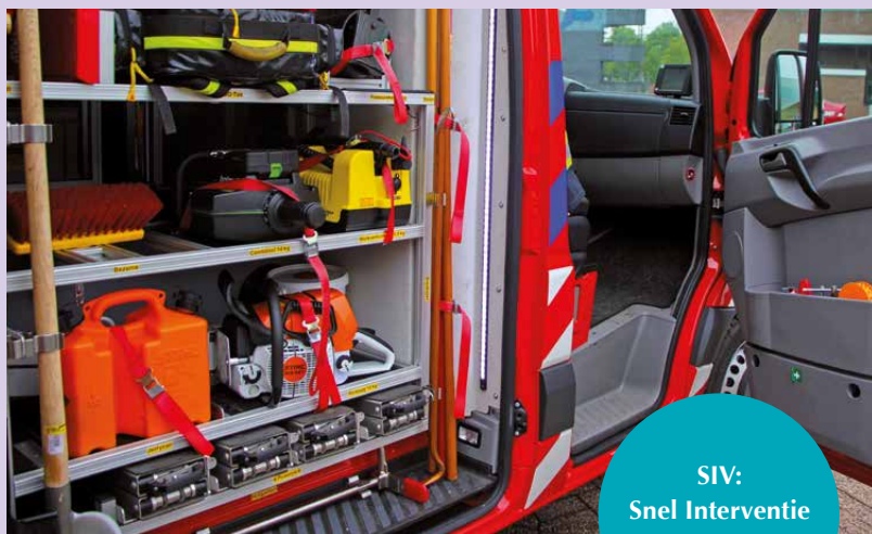
SIV: Snel Interventie Voertuig

Vooruitlopend op de komst van de tankautospuit kan het voertuig met twee manschappen erin alvast naar plaats incident. Hiermee kan de verkenning, hulpverlening en eventuele opschaling zo snel mogelijk beginnen. Daarnaast kan het voor kleine klussen met weinig risico zelfstandig worden ingezet. In 2017 start een pilot om te kijken of een post in landelijk gebied erbij gebaat is. ●