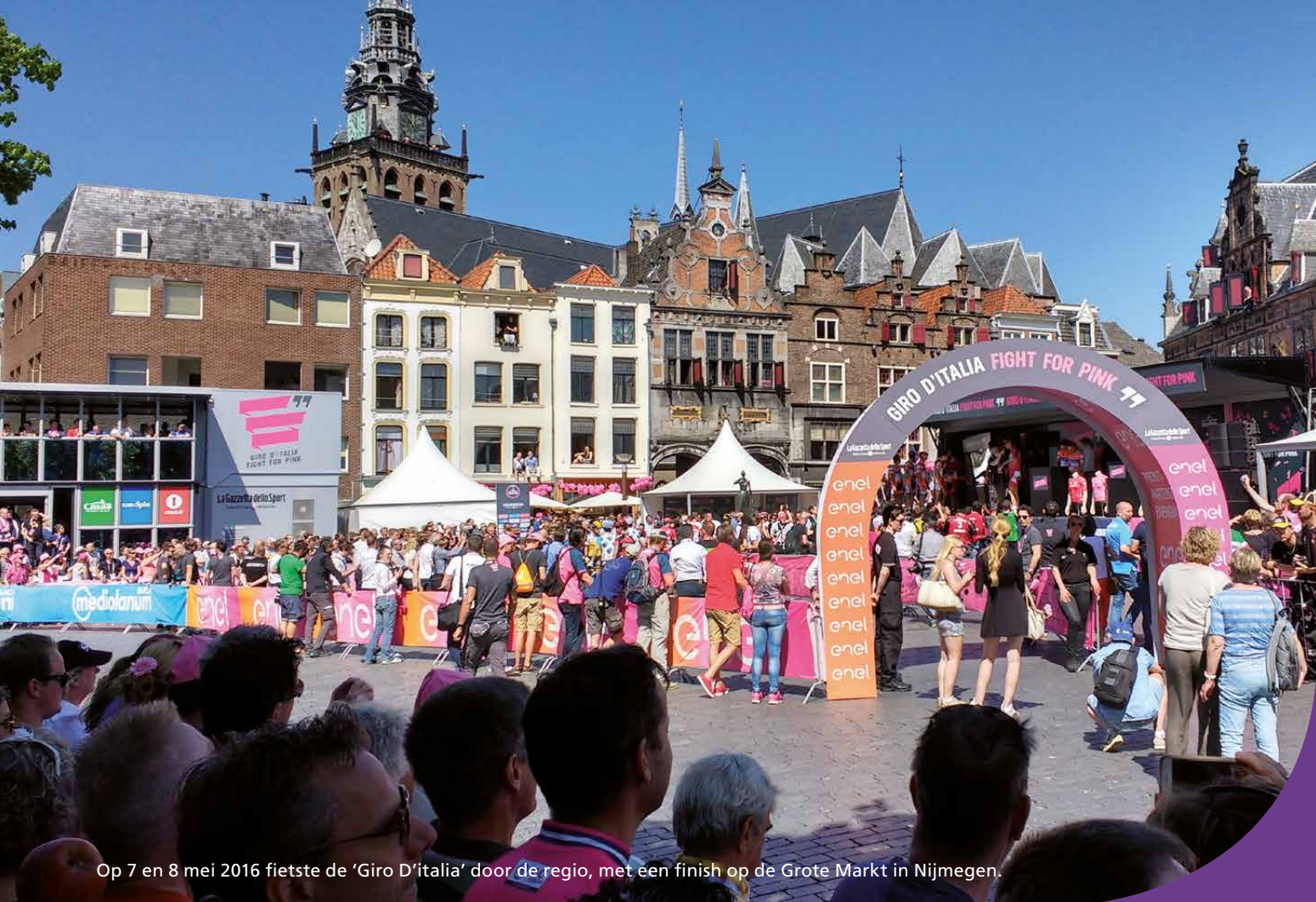
Op 7 en 8 mei 2016 fietste de 'Giro D'Italia' door de regio, met een finish op de Grote Markt in Nijmegen.