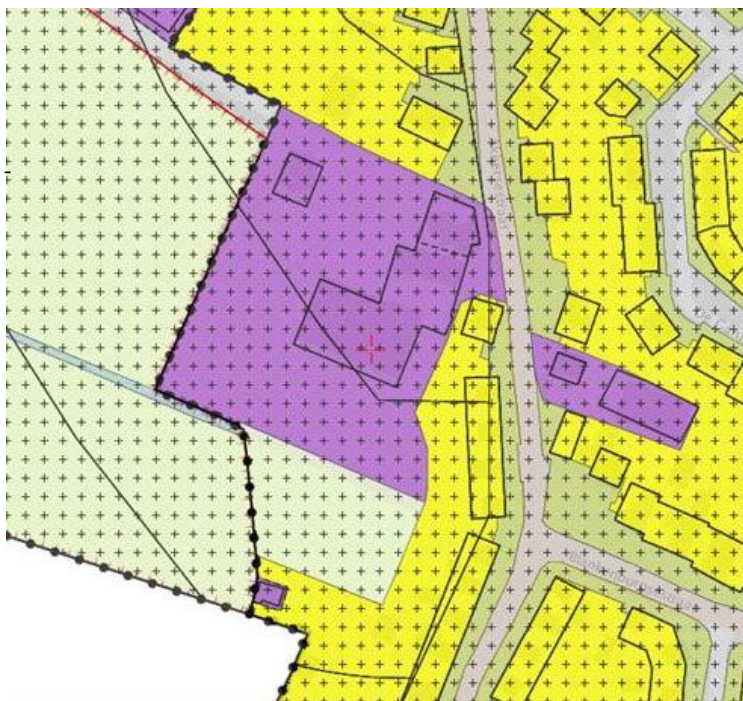
Uitsnede plankaart bestemmingsplan 'Kern Ophemert'

Ter plaatse van het plangebied vigeert het bestemmingsplan 'Kern Ophemert'. Dit plan is op 23 april 2009 vastgesteld. Voor het plangebied vigeert de enkelbestemming 'Bedrijf' en de dubbelbestemming 'Waarde - Archeologie 2'.