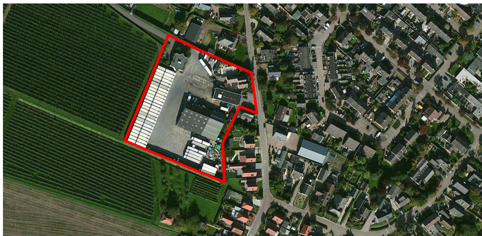
Ligging en omvang plangebied