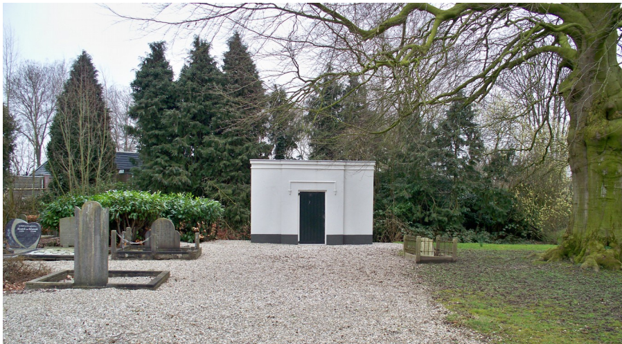
Afbeelding 2 Baarhuisje Stoepstraat Opijnen, niet in gebruik

Alle gemeentelijke begraafplaatsen kennen één of meerdere baarhuisjes. Deze zijn niet alle in gebruik. De baarhuisjes op de begraafplaatsen Haaften Bovenhof (monument Dutry van Haaften), Opijnen Stoepstraat en het 'kleine' baarhuisje op de begraafplaats in Waardenburg (historische waarde) hebben geen functie meer. Zij worden meegenomen in de beheer- en onderhoudscyclus van de gemeente Neerijnen en drukken daarmee negatief op de exploitatie.