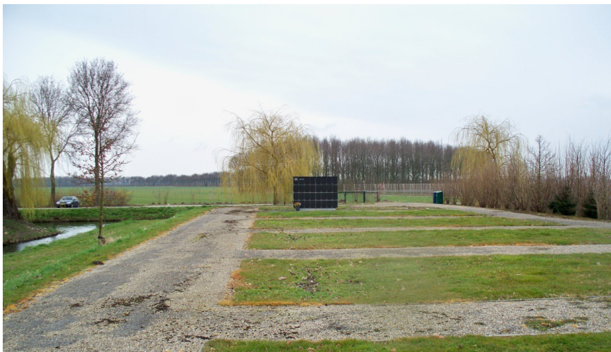
Afbeelding 1 Urnenmuur op begraafplaats Ophemert

Door de natte omstandigheden aan de voorzijde van de uitbreiding lukt het niet om beplanting te laten groeien rond de urnen muur. Deze betonnen urnenmuur staat nu op een kale vlakte zonder enige beslotenheid.